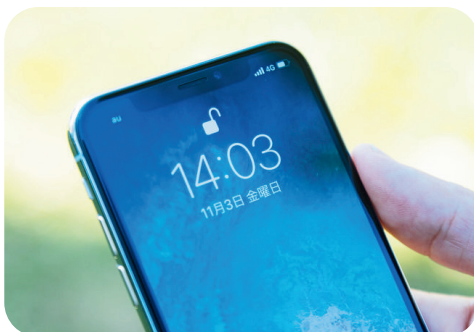
スマホの顔認証や電光掲示板にもmicro:bitの機能が応用されています